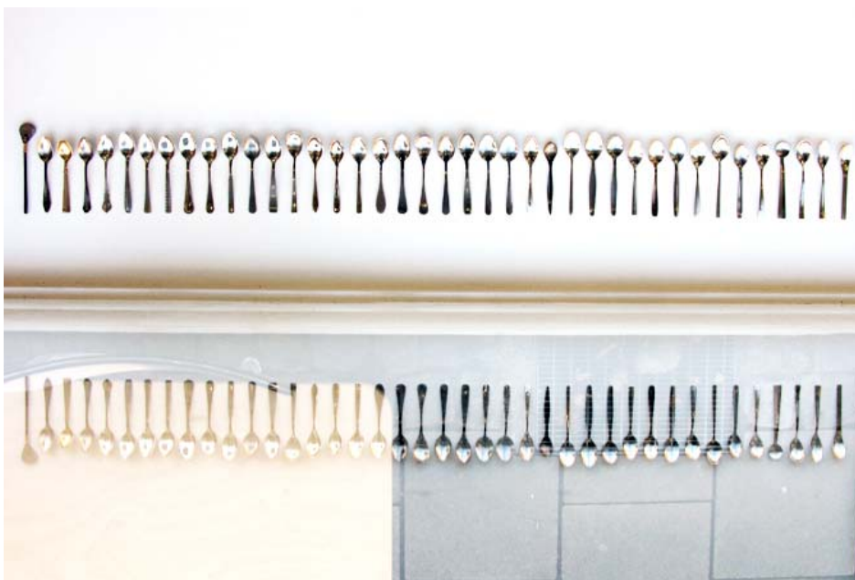
Die Begleiter des kleinen Schwarzen, eins Komma fünf Meter Typologie des Mokka Löffels.