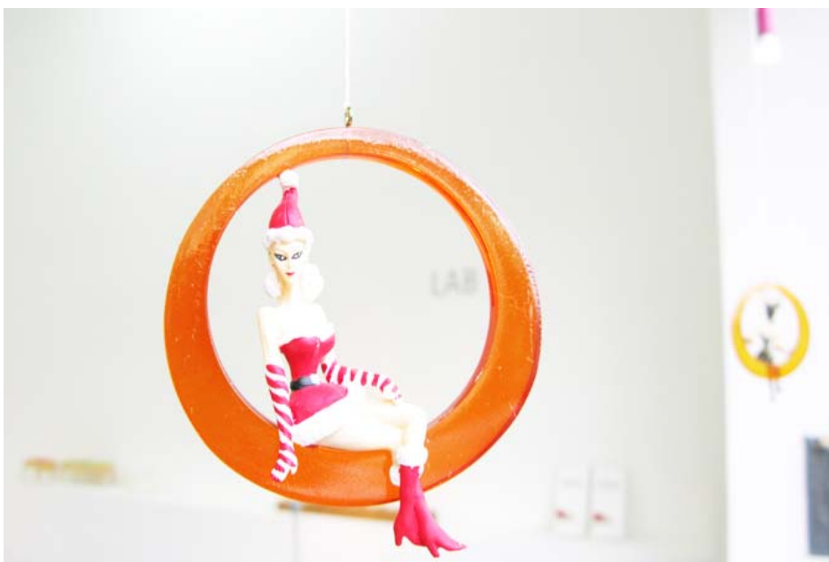
Wir wünschen uns etwas von Allem für Alle.