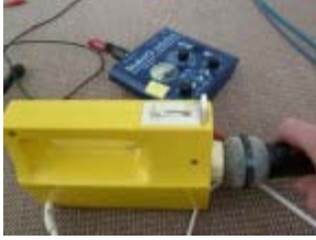
Küchenmixer (Frieder Butzmann)

Klangbeispiel 3: Bedrohliches Raumschiff [ http://ondemand-mp3.dradio.de/file/dradio/2012/02/27/drk_20120227_0005_ca20140b.mp3 ]