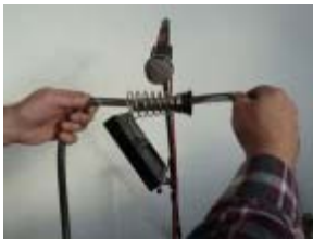
Spiralfedern mit Tonabnehmer (Frieder Butzmann)

Der Synthesizer Arp 2600 aus den 70ern liefert zusammen mit digitaler Bearbeitung die sprachliche Gestik des Roboters R2D2